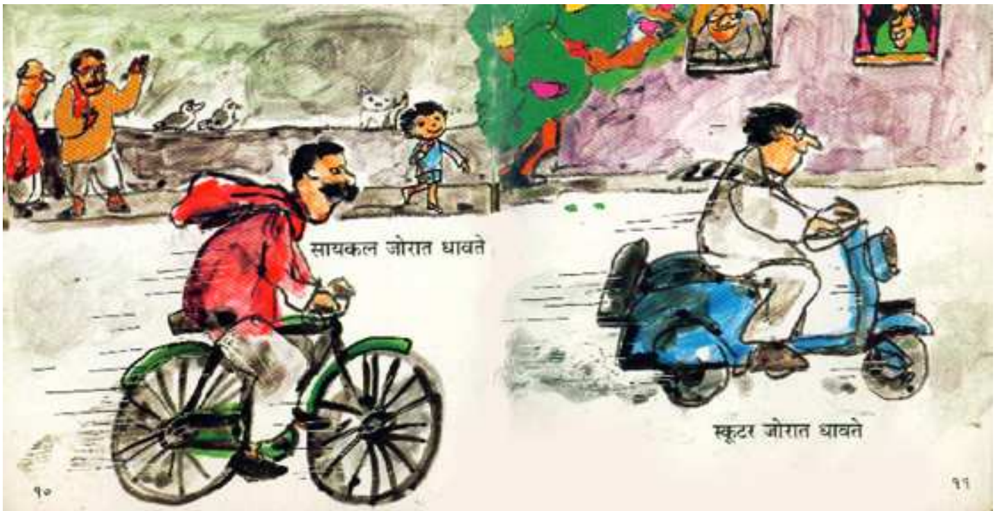
The cycle runs fast साइकिल तेजी से दौड़ती है