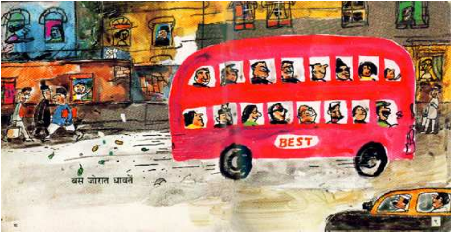
The bus runs fast बस तेजी से दौड़ती है