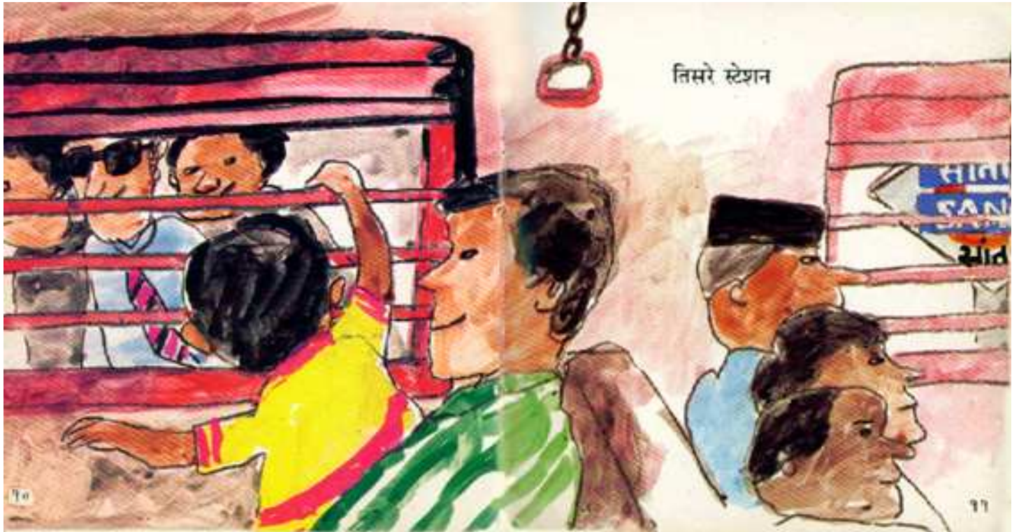
Third station तीसरा स्टेशन