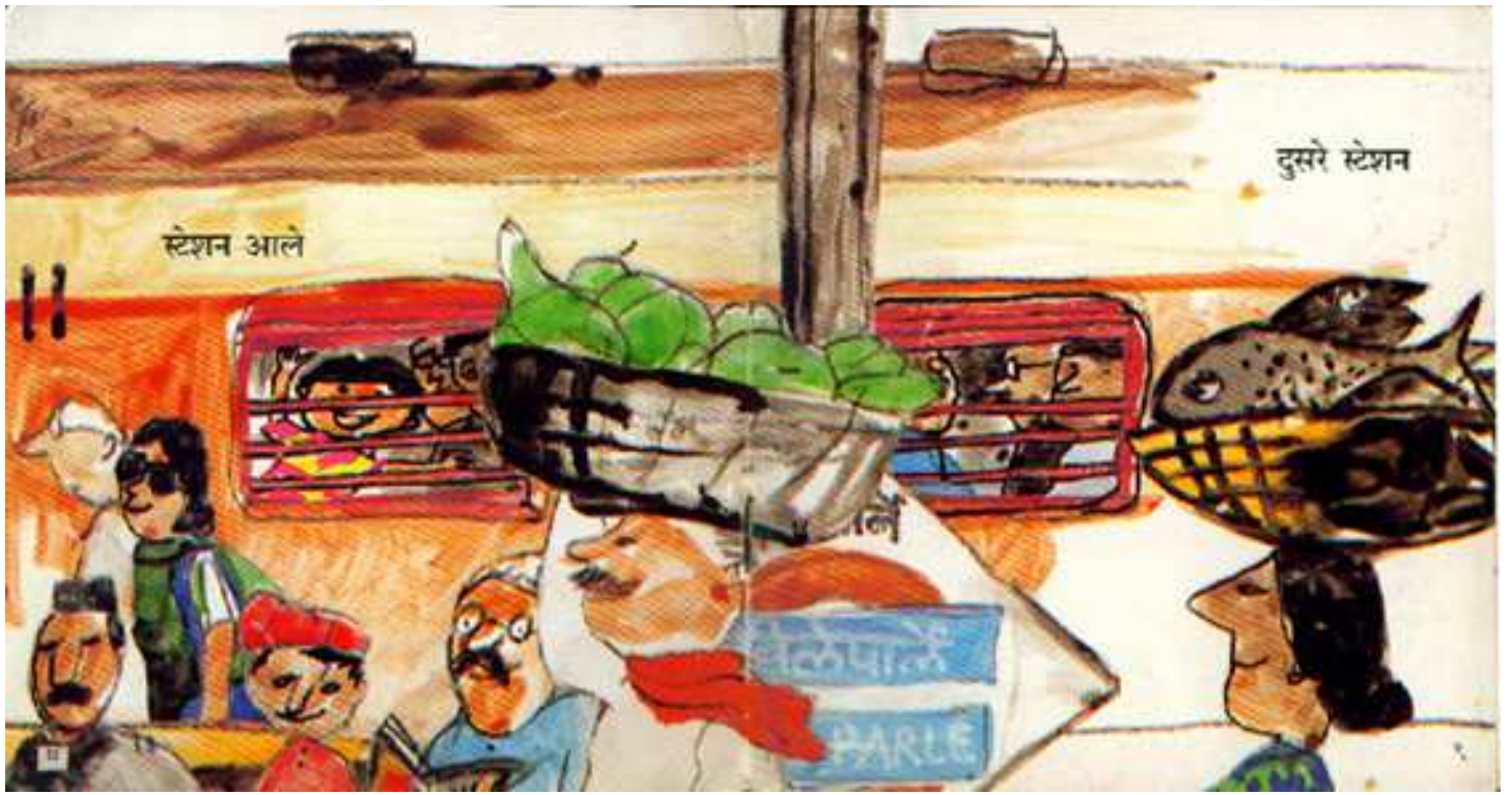
Station came स्टेशन आया