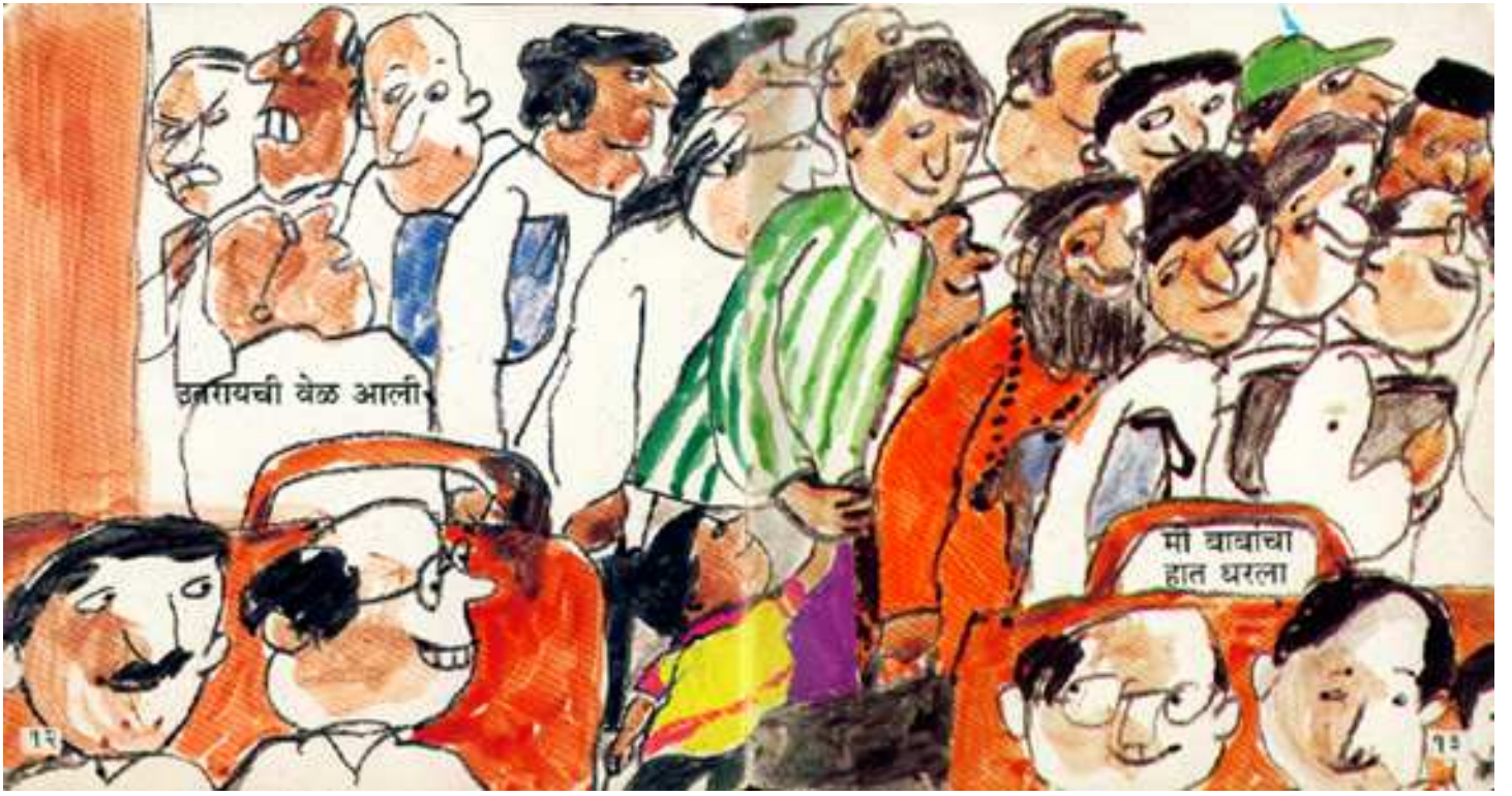
Time to get down उतरने का समय आ गया