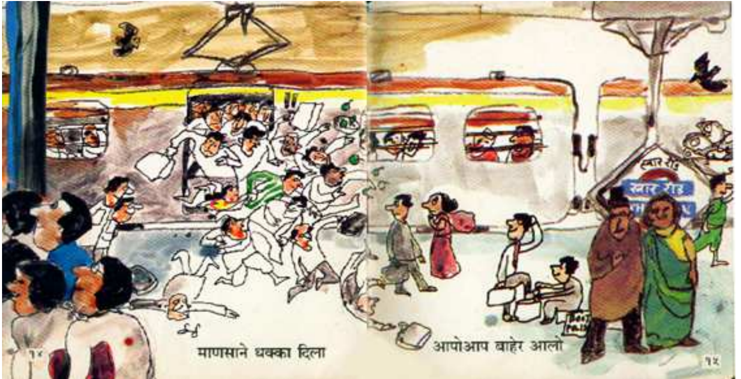
People pushed from behind लोगों ने पीछे से धक्का दिया