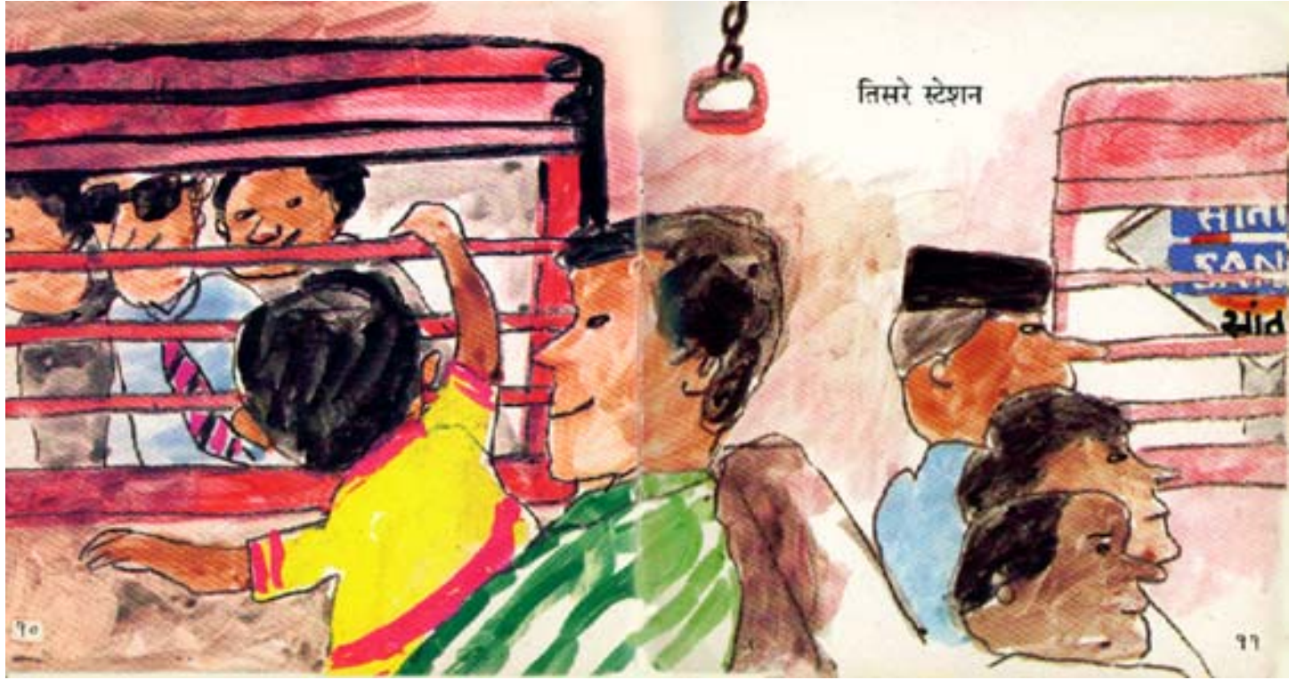
Third station तीसरा स्टेशन मोरने निल्लाण